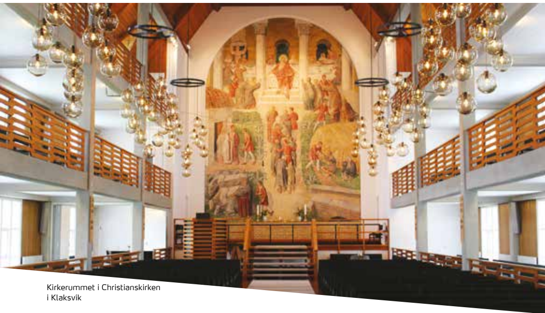
Kirkerummet i Christianskirken i Klaksvík

og forskydningerne er så store, at det hele antager et opløst, kubistisk præg, når værket ses tæt på eller fra siden. Enkelthed og kompleksitet går hånd i hånd, idet fortællingen beriges af det dekorative præg, der skabes af de abstrakte formationer af brikkerne, ofte i heftige rytmer.