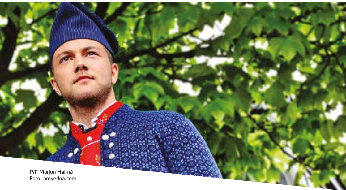
P/F Marjun Heimá

første at virke kompenserende hvis kvinden, skal vi sige, bliver lidt større, så hun kan bruge samme trøje. Den anden funktion er at virke som fremhævende underlag for dragtens sølvudsmykning.