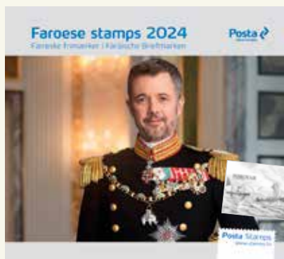
Árbog 2024 - gratis sorttryk inkl. Pris: 735,- DKK