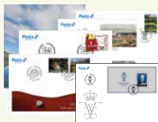
FDC-mappe 2024 Mappen indeholder alle årets førstedagskonvolutter med frimærkesæt og med miniark udgivet i år. Pris: 796,- DKK