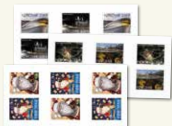
Hæftemappe 2024 Mappen indeholder de selvkøbende frimærkehæfter, der blev udgivet i år. Motiver: Sandoy-tunnelen, Europa 2024 og julemanden, Julius. Pris: 504,- DKK