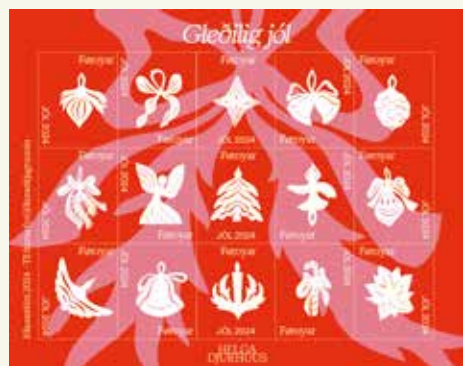
Julemærker 2024 Kunstner: Helga Djurhuus. Pris: 30,- DKK