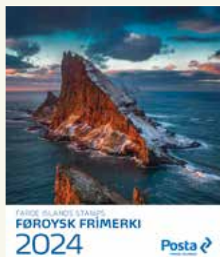
Ársmappe 2024 Pris: 719,- DKK