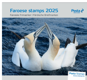
Årbog 2025: 735 DKK